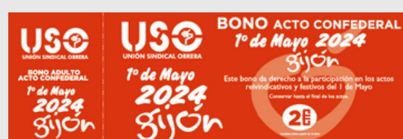
*Bono de carácter informativo, sin valor contractual

El "bono infantil" es para niños y niñas menores de 13 años. Con ese bono tendrán derecho al autobús, a comida y bebida, algunas sorpresas y servirá de control para saber el número de niños y niñas que acudirán, de cara a la preparación de actividades infantiles.