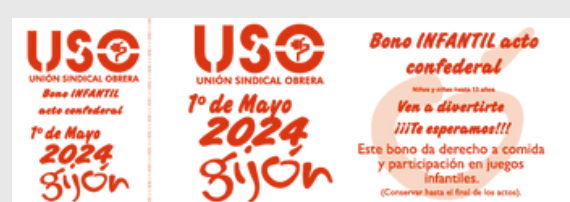
*Bono de carácter informativo, sin valor contractual